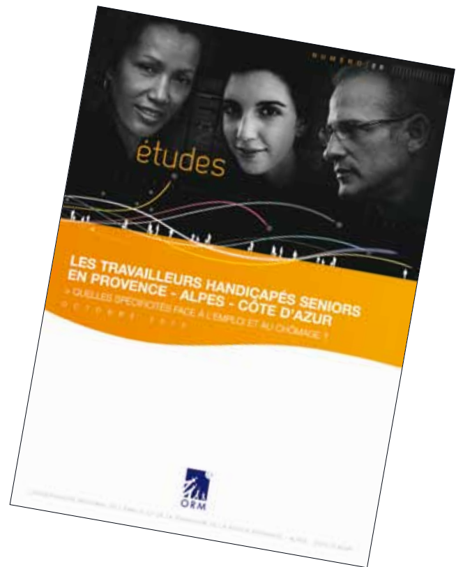
Les travailleurs handicapés seniors en Provence - Alpes - Côte d'azur Octobre 2012