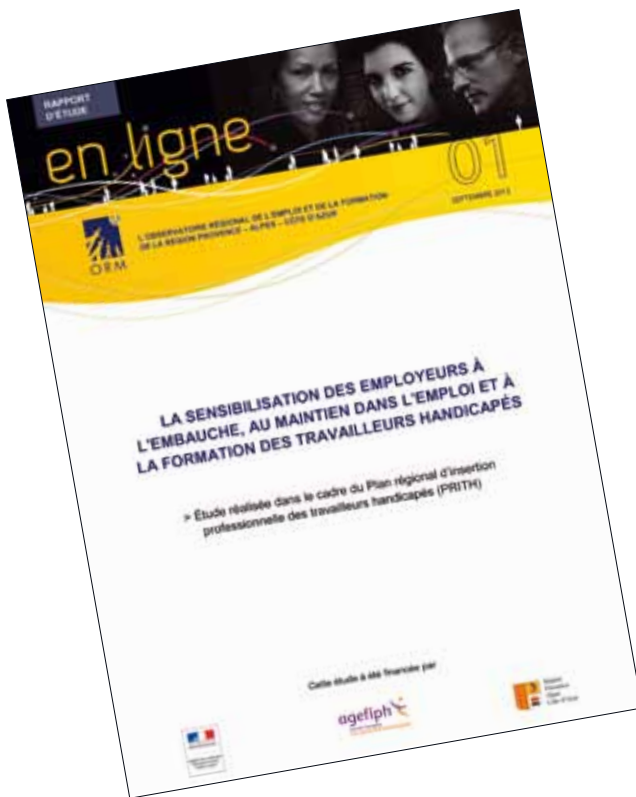
La sensibilisation des employeurs à l'embauche, au maintien dans l'emploi et à la formation des travailleurs handicapés Septembre 2012