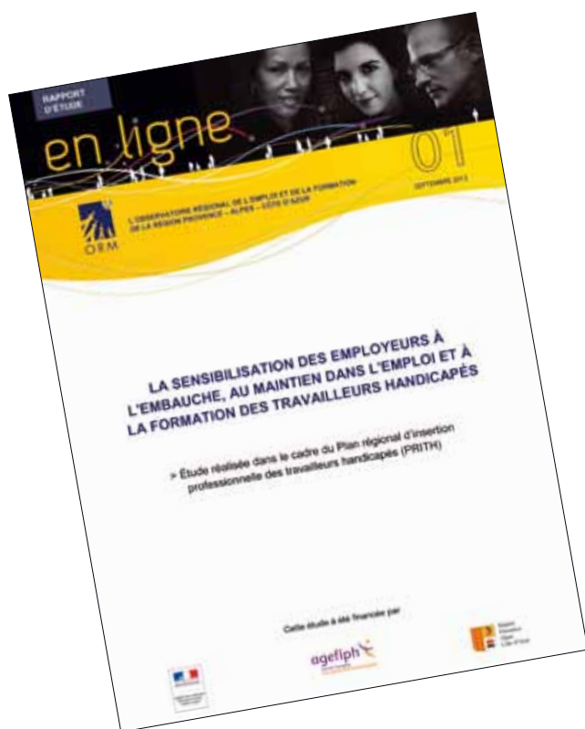
La sensibilisation des employeurs à l'embauche, au maintien dans l'emploi et à la formation des travailleurs handicapés Septembre 2012