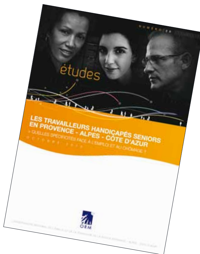
Les travailleurs handicapés seniors en Provence - Alpes - Côte d'azur Octobre 2012